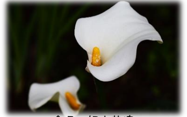
今月の姫中花壇 「カラー」

新年度が始まり、早くも1か月が経ちます。1年生のみなさんは中学校生活には慣れましたか？新しい学校、新しい学年になって1か月、疲れが出始めるころだと思います。体育大会の練習も始まってきています！規則正しい生活と、栄養たっぷりの食事をして、毎日元気に過ごしましょう。