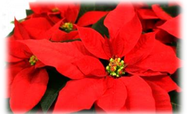
12月に咲く花「ポインセチア」

いよいよ、冬本番です。かなり冷え込むようになってきました。体調管理に努め、元気に過ごせるようにしましょう。