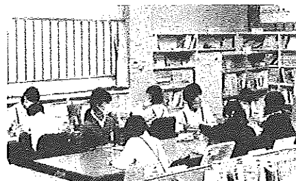
輝塾で学習する6年生