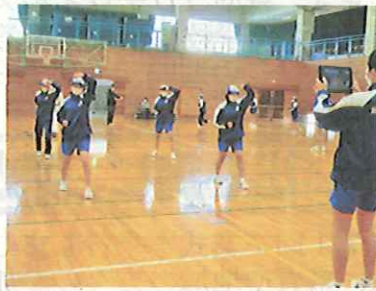
【タブレットPCを使い動画撮影】