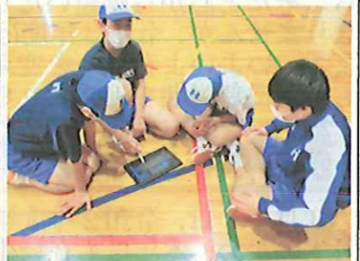
【動画を見て改善点の協議】