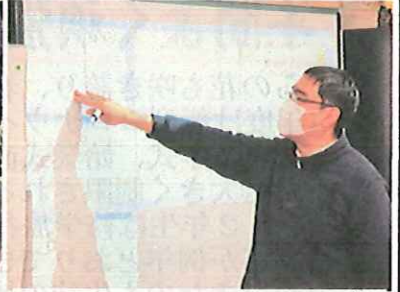
【グループの意見を集約して共有】