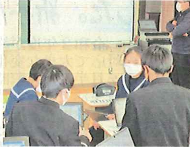
【タブレットPCを使い意見交換】

どちらの授業もICTの利点を生かした効果的な活用がなされ、子供たちも意欲や関心を持って授業に参加する様子が見られました。また、授業後に行った研究会でも先生方から積極的な意見が出され、参考点はそれぞれの授業で生かしていきます。