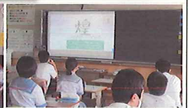
各学級、スクリーンを見ながら真剣に話を聴きます