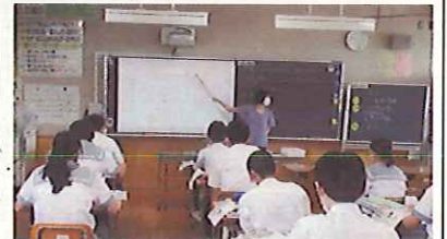
授業の学習課題と流れを提示PCの内容をスクリーンで説明

23日、2年社会科と1年数学科で研究授業を行いました。タブレットに記入した自分の考えを全体で共有し、そのことをさらに深めていくなど、それぞれの授業で工夫された活動が行われました。多くの先生が参観する中子供たちはやや緊張していましたが、しっかりと活動を行っていました。