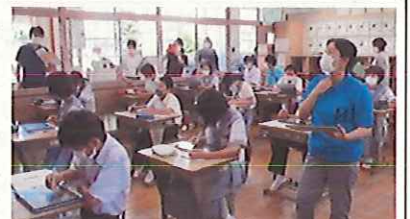
タブレットを使って、一人一人が自分の考えをまとめます