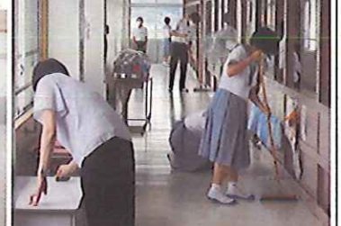
先生も一緒に黙々と清掃作業を行います