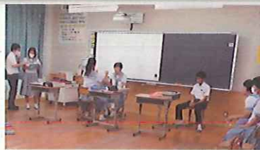
カメラ越しに説明をする生徒会役員の皆さん

23日、生徒総会を行いました。例年であれば体育館に全校生徒が集まり、生徒会執行部が説明を行い、協議した上で議決していくところですが、本年度は新型コロナウイルス感染予防対策によりICTを活用し、Zoomを使用したオンライン総会となりました。生徒会執行部がカメラ越しに説明を行い、他の生徒は各教室でスクリーンを通して説明を聞きました。本年度の生徒会のテーマは“煌～Believe yourself～”に決まりました。自分と周りの人を信じる氷川中生、どんなことにも恐れず挑戦する氷川中生、いろいろな場面で一人一人が煌めく氷川中生を目指して、主体的に活動してほしいと思います。