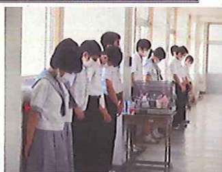
掃除は整列し、黙想に始まります

本校の掃除時間は素晴らしいです。本校では縦て割り班での無言清掃を行っています。掃除の15分間、人がいるのか分からないくらい静まりかえった中で掃除が行われます。掃除は、黙想から始まります。その後はそれぞれの掃除場所において、無言で一生涯懸命に清掃活動を行います。最後にその日の掃除の振り返りを行って終了。子供たちが黙々と清掃活動を行う姿は、校訓にもある洗心、奉仕に通じるものがあると感心させられます。