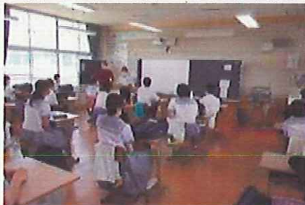
↑3年生は在籍者数が多いので、20人程度の2クラスに分け、距離を保って授業。