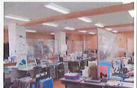
↑職員室もシートを張り、職員どうしも感染予防に。