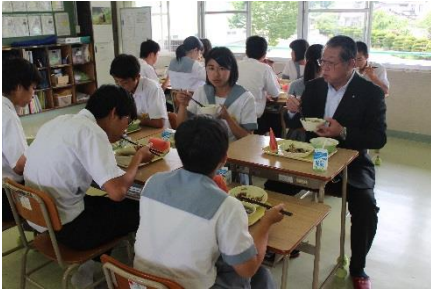
会食の様子 「みんな ちょっと緊張気味です」

中の取組は素晴らしい。」等のご意見をいただきました。生徒や職員の間、頑張りをお褒めいただき、大変嬉しく、また有難く思いました。