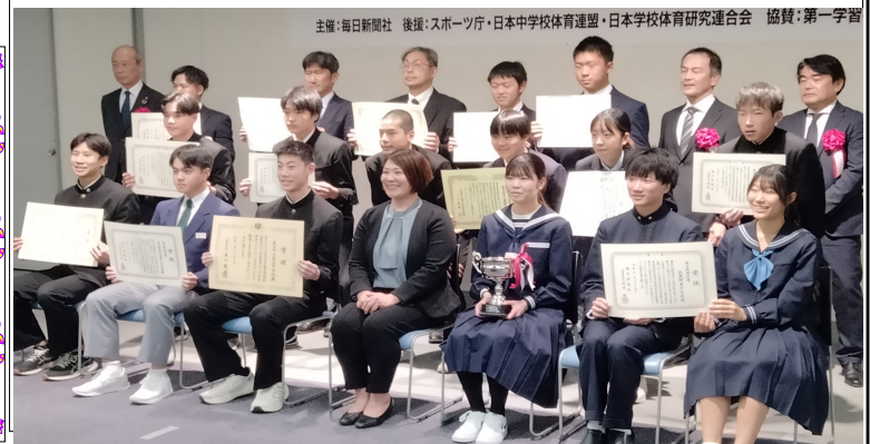
主催：毎日新聞社 後援：スポーツ庁・日本中学校体育連盟・日本学校体育研究連合会 協賛：第一学習

全国 3, 827校から ～ 全国6位 【優秀賞】 受賞 日時：12月7日 場所：東京都毎日新聞社本社 *写真中央は、アテネ・北京五輪柔道金メダリスト 谷本 歩実さん