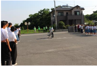
（あいさつと校舎に一礼）