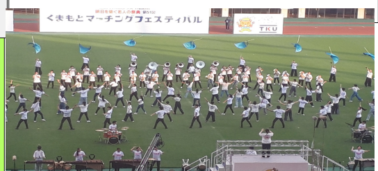
先月10日、吹奏楽部が玉名地区合同で演奏しました