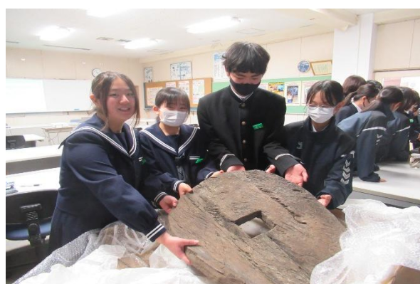
発掘された木製構造物の一部