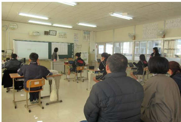
授業参観（3年生：国語）