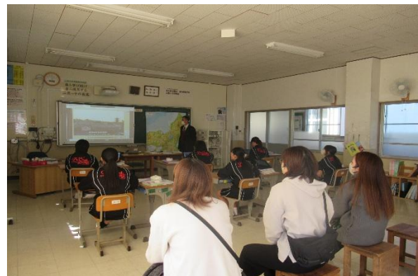
授業参観（2年生：社会）