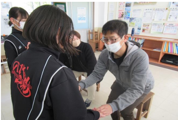
授業参観（1年生：家庭）

授業の後半では、別室で学校運営協議会を開催しました。学力や体力、施設等の環境面に係る学校の現状をお伝えし、委員の皆様から貴重な意見をいただきました。いただいた意見は、今後の学校経営に生かして参ります。ご多用な中、参加いただきました保護者及び学校運営協議会の皆様に心よりお礼申し上げます。