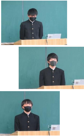
三学期の抱負（各学年代表）

三年生のみなさんにとっては、自分の目標に向かってラストパートをかける時期です。そして、この天草中学校で過ごす最後の学期となります。一日一日、一つ一つを大事に過ごしてください。そして、卒業する者の務めとして、天中生としての誇り（プライド）を持った姿を後輩に残していただきます。