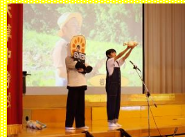
1年生「VIVA 天草」 レンコンを収穫し、調理したことから学んだことを、劇仕立てでステージ発表しました。