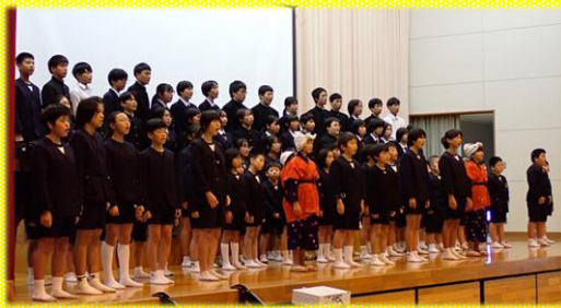
小中合同での『福連木の子守唄』合唱 ※熊日新聞読者の広場「若者コーナー」にも、生徒の作文が掲載されました（学校ホームページでも見れます）。