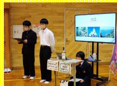
2年 高浜ぶどう&福連木の子守唄 「天草町の伝統文化を受け継ぐ」