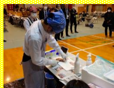
3年お魚教室 「天草の自然の恵みをいただく」