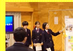
2年職場体験 「わたしたちの未来と天草の未来」