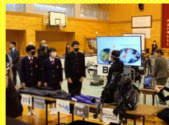
3年ダイビング体験 「天草町の豊かな自然とともに」