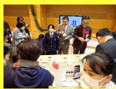
3年香育ワークショップ 「天草の自然を生かして働く」