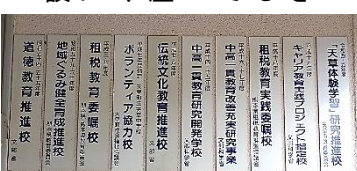
天草中学校研究発表の歴史

天草中の研究履歴が、玄関右の壁に掲げられています。そこに新たなプレートを設置しました。(写真右端)