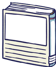
『にゃんこ四字熟語辞典』 西川清史：著 飛鳥新社：出版