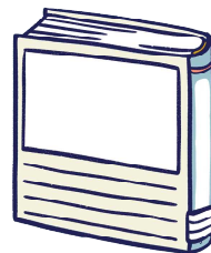
『その本は』 又吉直樹、ヨシタケシンスケ：著 ポプラ社：出版