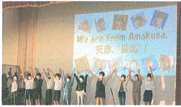
▲1年生劇 "We are from Amakusa!"

展示では、風景画・毛筆作品・総合的な学習の時間のまとめ・大空学級の様子などが展示されました。どの展示も一人一人が一生懸命に取り組んだ様子が作品を通して伝わってきました。