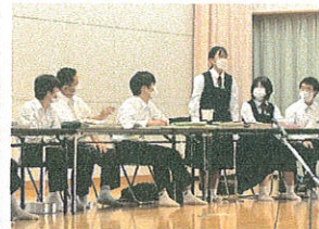
▲3年生劇 "幕のあがるまで2022"