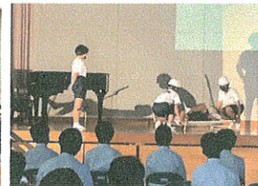
▲2年生劇 "職場体験レポート R4"