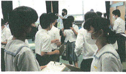
話しかけながら楽しく会話していました。

SSTは、与えられた課題を互いに交流しながら解決することを通して、コミュニケーション能力を高めていくことを目的とした活動です。天中では昨年から取り組み始めました。昨年度は教師主導で行っていましたが、今年度からは生徒会主導で行うことになりました。第1回は「MAIN」。