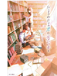
『ないものねだりの君に光の花束を』汐見夏衛/KADOKAWA