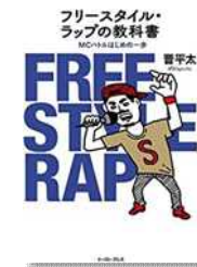
『フリースタイル・ラップの教科書』晋平太/イーストプレス

読書アンケートの結果も参考に、購入しました！人気シリーズの続編、マンガ原作の小説、恋愛小説など盛りだくさん！ラップや、バスケットボールの本もありますよ♪