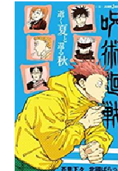
『呪術廻戦』芥見下々/集英社