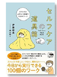
『セルフケアの道具箱』伊藤絵美/晶文社