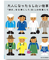
『大人になったらしたい仕事 1・2』朝日中高生新聞編集部/朝日学生新聞社