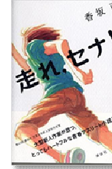
『走れ、セナ!』香坂直/講談社