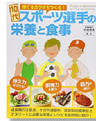
『10代スポーツ選手の栄養と食事』川端理香/大泉書店

★陸上がテーマの小説、やる気が出てくる詩、身体に良い食事の本などジャンルも色々！