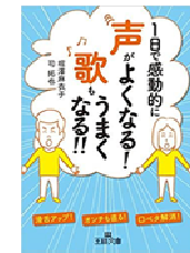
『1日感動的に声がよくなる! 歌もうまくなる!』堀澤麻衣子・司拓也 三笠書房