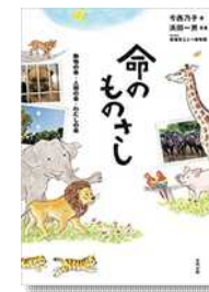
『命のものさし』 今西乃子／合同出版

→直木賞、本屋大賞を受賞した『蜜蜂と遠雷』のスピノフ短編集です。音楽に溢れた世界をもう一度！