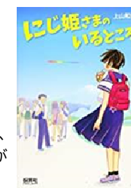
『にじ姫さまのいるところ』 上山和音／保育社