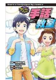
『マンガでマスター手話教室』 早瀬憲太郎／ポプラ社

←新札の肖像に選ばれた三人に加え、旧札の偉人についても、楽しく学べます！マンガと読み物で、わかりやすく学べます！