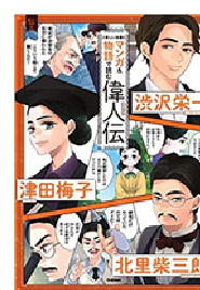
『マンガ&物語で読む偉人伝』 渋沢栄一・津田梅子・北里柴三郎 ／学研プラス

←新札の肖像に選ばれた三人に加え、旧札の偉人についても、楽しく学べます！マンガと読み物で、わかりやすく学べます！