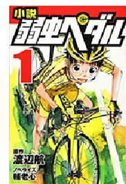
『小説 弱虫ペダル』 渡辺航／岩崎書店

←舞台、ドラマ、映画化などもされた人気作品です！アニメオタクの主人公が、自転車に出会ってからの、成長ストーリーです！