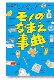
『モノのなまえ事典』 杉村喜光／ポプラ社

←舞台、ドラマ、映画化などもされた人気作品です！アニメオタクの主人公が、自転車に出会ってからの、成長ストーリーです！