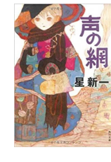
『声の網』 星新一／角川書店