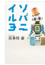
『ソバニルヨ』 喜多川泰／幻冬舎