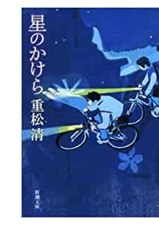
『星のかけら』 重松清／新潮社