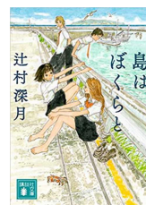
『島はぼくらと』 辻村深月／講談社