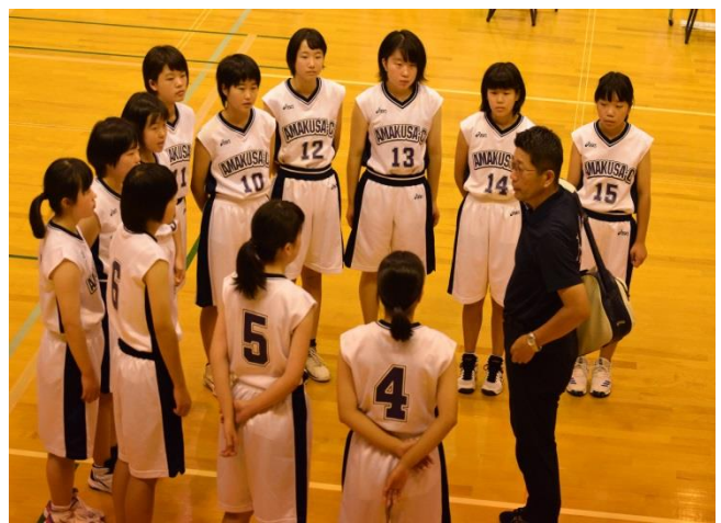
<女子バスケットボール部>