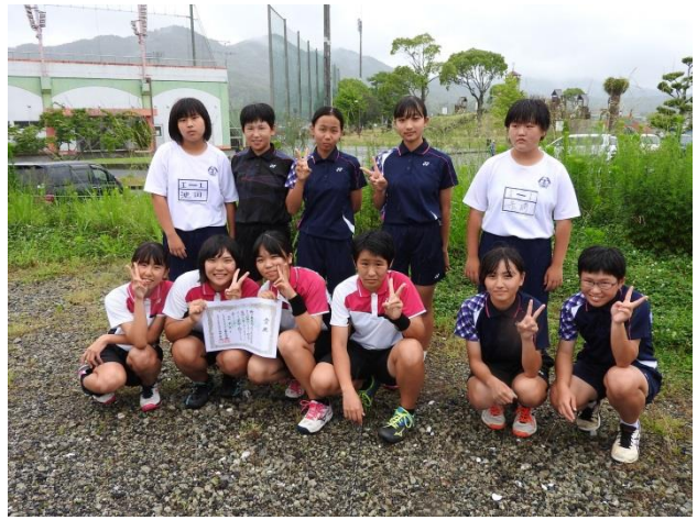
<女子ソフトテニス部>