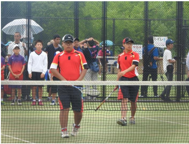
<男子ソフトテニス部>

6月29日（土）から始まった天草郡市中体連夏季総合体育大会は、雨天等の影響もあり、決して十分なコンディションではありませんでしたが、天草中学校の4部活動とも全力を出して頑張りました。勝負ごとですので、全員が納得いく結果を出すことは難しいですが、持っている力は出し切ったと思いますし、今後の陸上や駅伝、その他の活動にいい形につながってくれるものと思います。