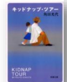
「キッドナップ・ツアー」 角田光代/新潮社 5年生の夏休み、私は誘拐された。犯人は二ヶ月前にいなかった父。