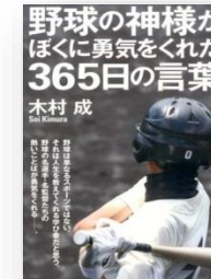
「野球の神様がぼくに勇気をくれた 365日の言葉」 木村成/泰文堂