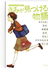
「きみが見つける物語 スクール編」 あさのあつこ、恩田陸、村上春樹他 角川文庫編集部/角川書店