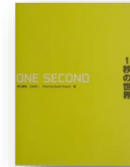
「1秒の世界」山本良一 ダイヤモンド社 1秒間に世界がどう変わっていくのかがわかる本