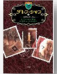
ダレン・シャン 奇怪なサーカス ダレン・シャン/小学館 マンガ化、映画化もされた大ヒット作。