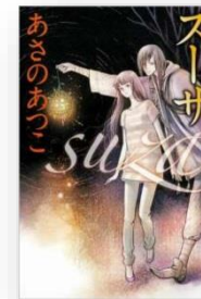
「スーサ」 あさのあつこ/徳間書店 どんなものでも売買する幻の商人スーサと少女の物語