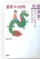
「重要な任務 ショートショート セレクション」 星新一/理論社